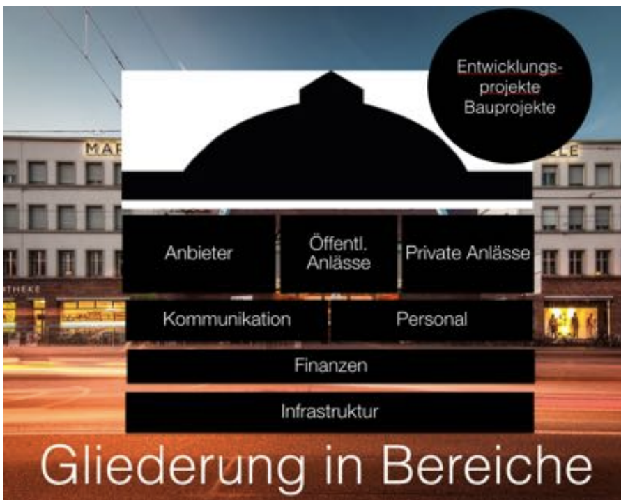
Gliederung der Bereiche.